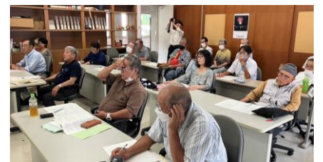
学習会には30人以上が参加しました。

下伊那郡西部を通る「中馬街道」について、これまで街道の石造物や歴史の学習会を行ってきました。